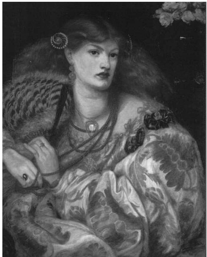
« Monna Vanna » de Dante Gabriel Rossetti-1866