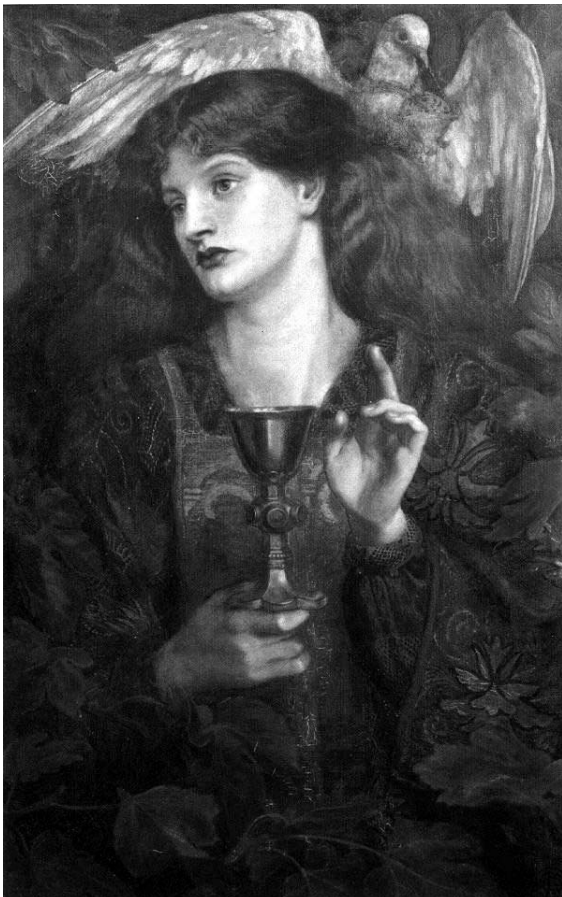
« The Holy Grail » de Dante Gabriel Rossetti-1860

Ce mouvement, qui fut pourtant de courte durée, eut une influence importante sur les mouvements artistiques du XIXe siècle, particulièrement l'art nouveau et le symbolisme, grâce à des artistes comme William Morris et Aubrey Beardsley.