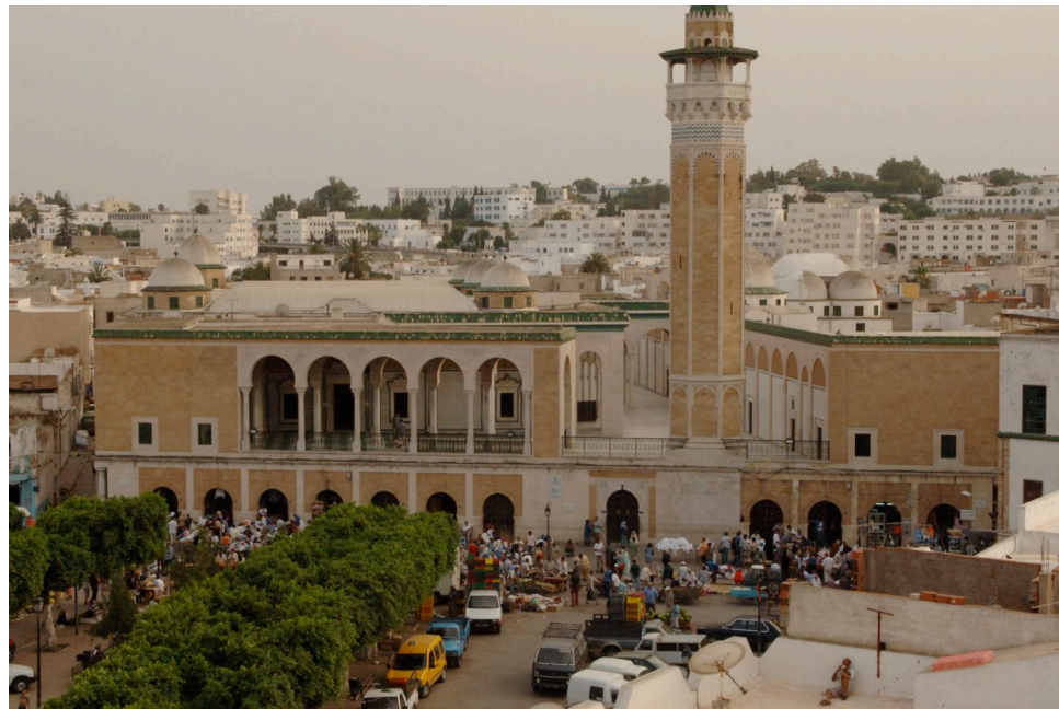
Place Halfaouine à Tunis, lieu de l'école de Cirque de Tunis

Production : L'École du Cirque de Tunis, Association Origami – Cie Gilles Baron et l'Agora – Scène conventionnée de Boulazac.