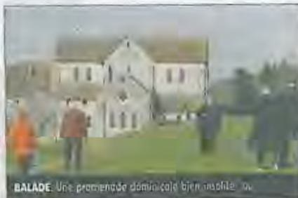
BALADE. Une promenade dominicale bien insolite.