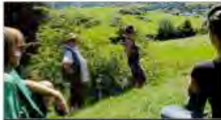
PANORAMA. Sur les hauteurs de PERLE (départ. chemin de la Côte-Blanche, et non rue Louis-Forgas), le public se met en quête des indices dissimulés dans le paysage.

Au fil d'un ensemble de stations disséminées à flanc de colline, au creux de petites dénivelés, les spectateurs goûtent les joies d'une Nature transfigurée par touches infimes, entre micro-installations plasticiennes et dispositifs