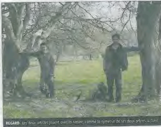
REGARD. Les deux artistes jouent avec la nature, comme la symétrie de ses deux arbres.

Ce show entre balade sensorielle et performance artistique sera présenté au moins du juin lors d'un festival d'Arts de la rue en Hollande. Puis reviendra dans sa version définitive pour les Journées du patrimoine à Noirlac.