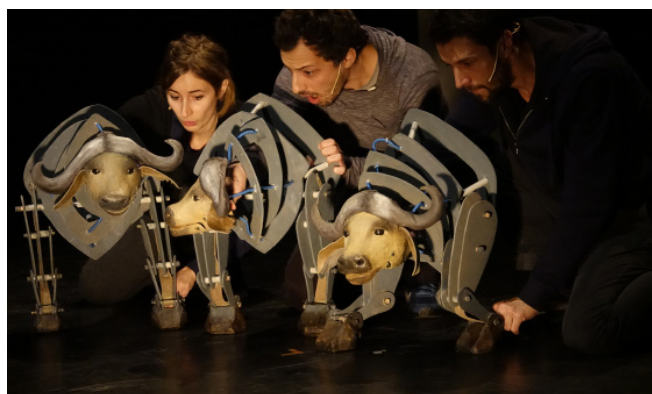
Prototypes de buffles - janvier 2018

La question n'est pas tranchée, il s'agira de trouver comment la parole traverse les corps animaux pour en trouver la poétique.