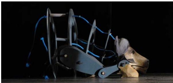
Prototype de buffles - janvier 18

Les acteurs agissent les marionnettes buffles et jouent de la distance qu'ils entretiennent avec la fable en jouant de la distance avec les marionnettes.