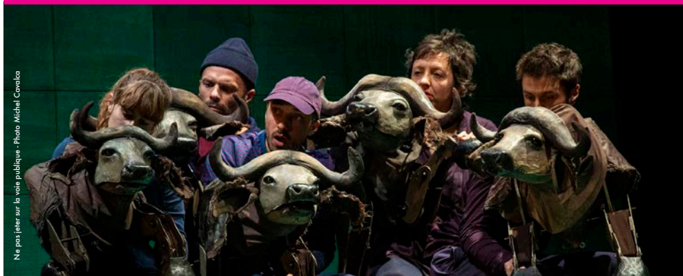
Ne pas jeter sur la voie publique

La Compagnie Arnica vous propose d'explorer à partir de jeux et d'exercices théâtraux et marionnettiques des extraits de la pièce Buffles , à l'aide de marionnettes animales ou anthropomorphiques. Vous découvrirez les fondamentaux de la marionnette : jeu théâtral, passage de la manipulation muette à la manipulation parlée, mise en scène d'un texte.