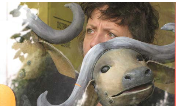
Prototypes de buffles - septembre 17

et du présent, et offrir une mise en perspective de l'histoire.