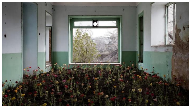
« Home » - Gohar Dashti