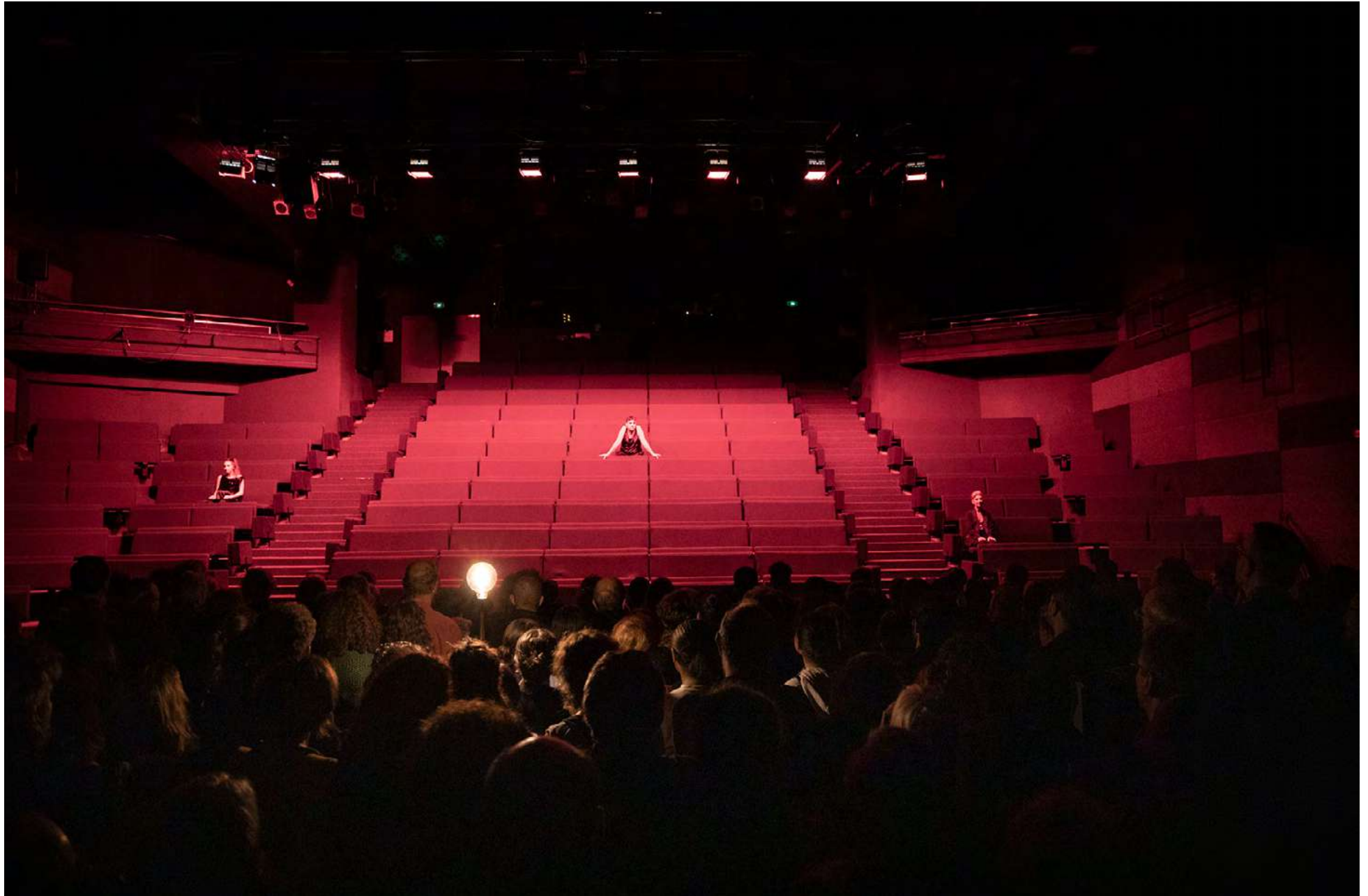
représentation au ZEF scène nationale de Marseille