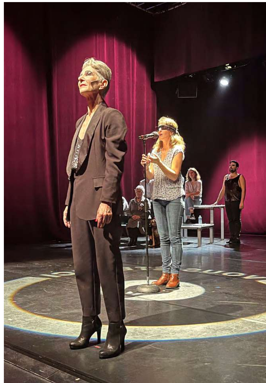
représentation au Théâtre Châtillon Clamart

Faisant du théâtre dans lequel ils se trouvent leur nouveau terrain de jeu, ils mèneront en direct une enquête auprès des «travailleurs de l'ombre », auprès des employés de la structure, pour révéler quelques secrets du lieu, tout en laissant le hasard s'inviter dans la représentation.