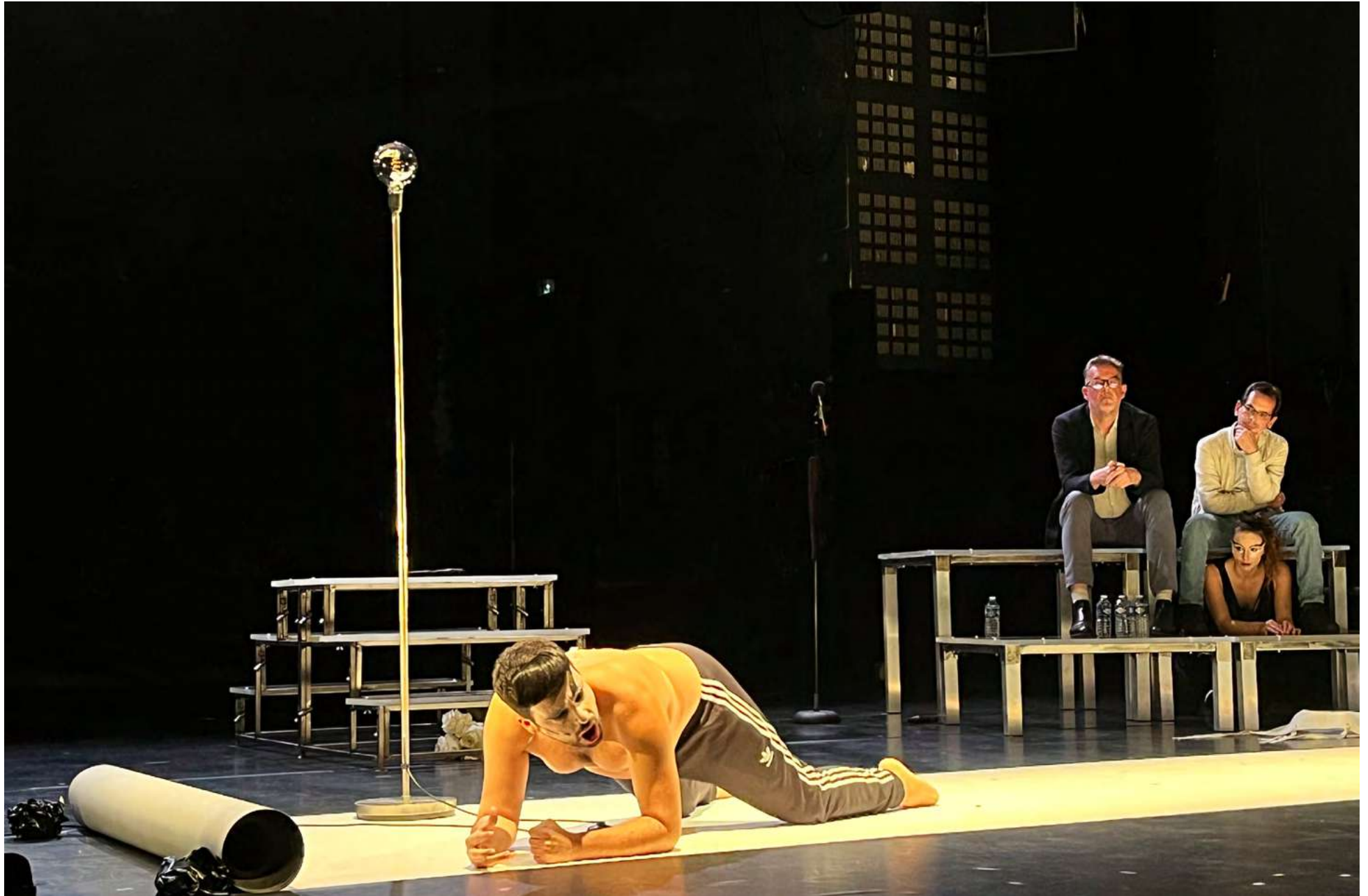
représentation au Théâtre Châtillon Clamart