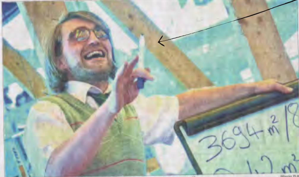
■ Le public s'involve dans l'histoire et participe à une représentation unique et mouvementée.

La pièce emprunte à cet instant un terrain montagneux. Le public répond comme il le souhaite, se regroupe par affinité d'opinion, défend son point de vue. Afin d'abolir totalement la frontière entre acteurs et spectateurs, il n'y a pas de projecteurs. Personne n'est dans l'ombre, chacun peut prendre la lumière. Pour aller plus loin, la compagnie Gravitation évite les grands théâtres où le public s'est habitué à la passivité. La troupe de Fabien Thomas préfère tourner en milieu rural, avec des paysans, des instituteurs, des artisans. « Ils sont beaucoup plus vivants et restent après la re-