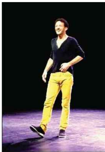
Vincent Dedienne manie l'humour avec raffinement

Virtuose de la dialectique, il fait de l'humour dans la dentelle, mul-