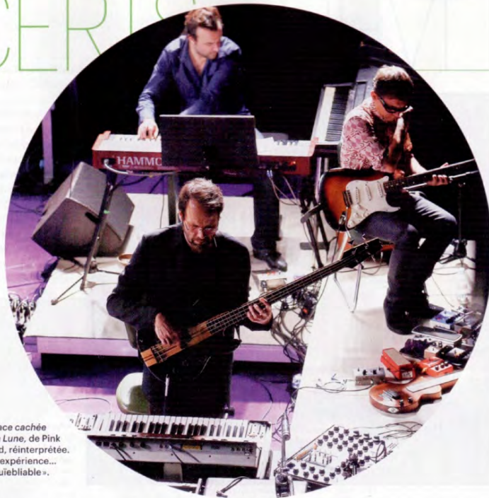
La Face cachée de la Lune, de Pink Floyd, réinterprétée. Une expérience... «inouïeblable».