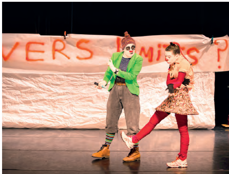
Tèn Tèn et Moulou dans « Vous êtes ici ».