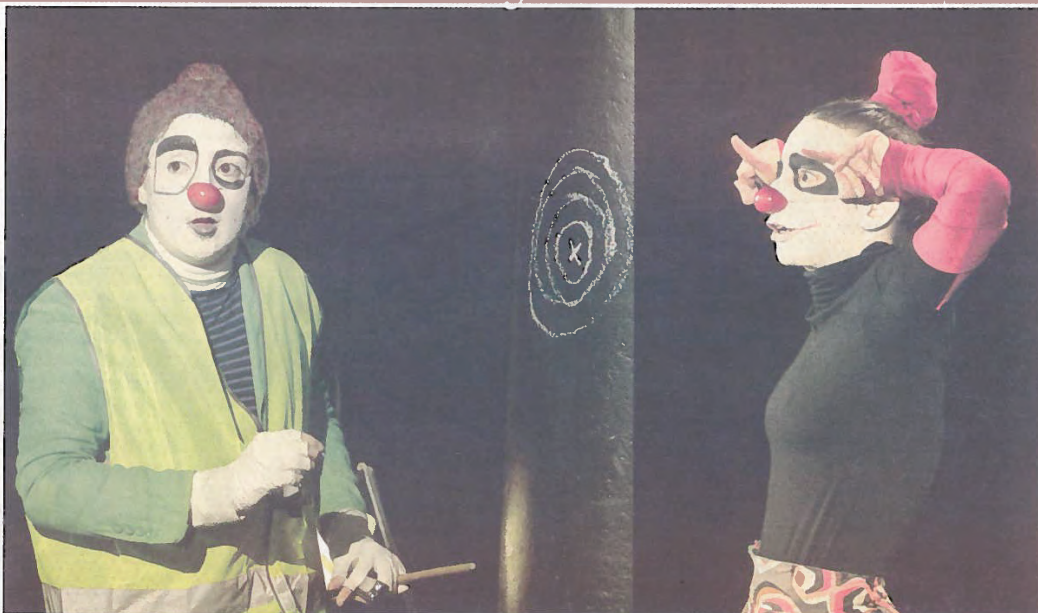
« Vous êtes ici », dès ce vendredi au Prato.

De la mi-mai à la mi-juin, toutes sortes de clowns en font des tonnes au Prato de Lille.