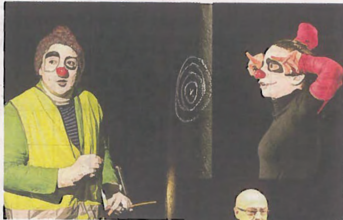
« Vous êtes ici », par la compagnie L'Ouvrier du drame.