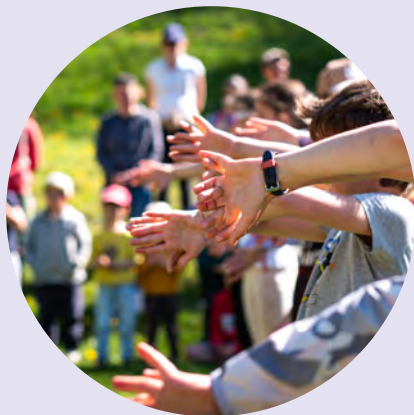
Projet Main_ tenons le lien à Flumet

Ce projet est soutenu par le CNRS et lauréat du programme PEPR ICCARE, rassemblant chercheurs pluridisciplinaires qui accompagneront toutes les étapes pour définir ensemble ce que participer signifie aujourd'hui.