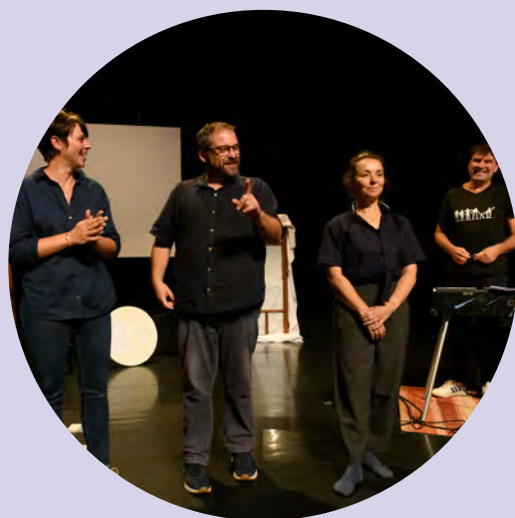
Sortie de résidence du Collectif BUS 21

Plusieurs rendez-vous ouverts à tous et toutes sont datés (voir pages 41 à 43), d'autres propositions surprises seront annoncées au fur et à mesure de la programmation, entre autres, dans le cadre des temps forts.